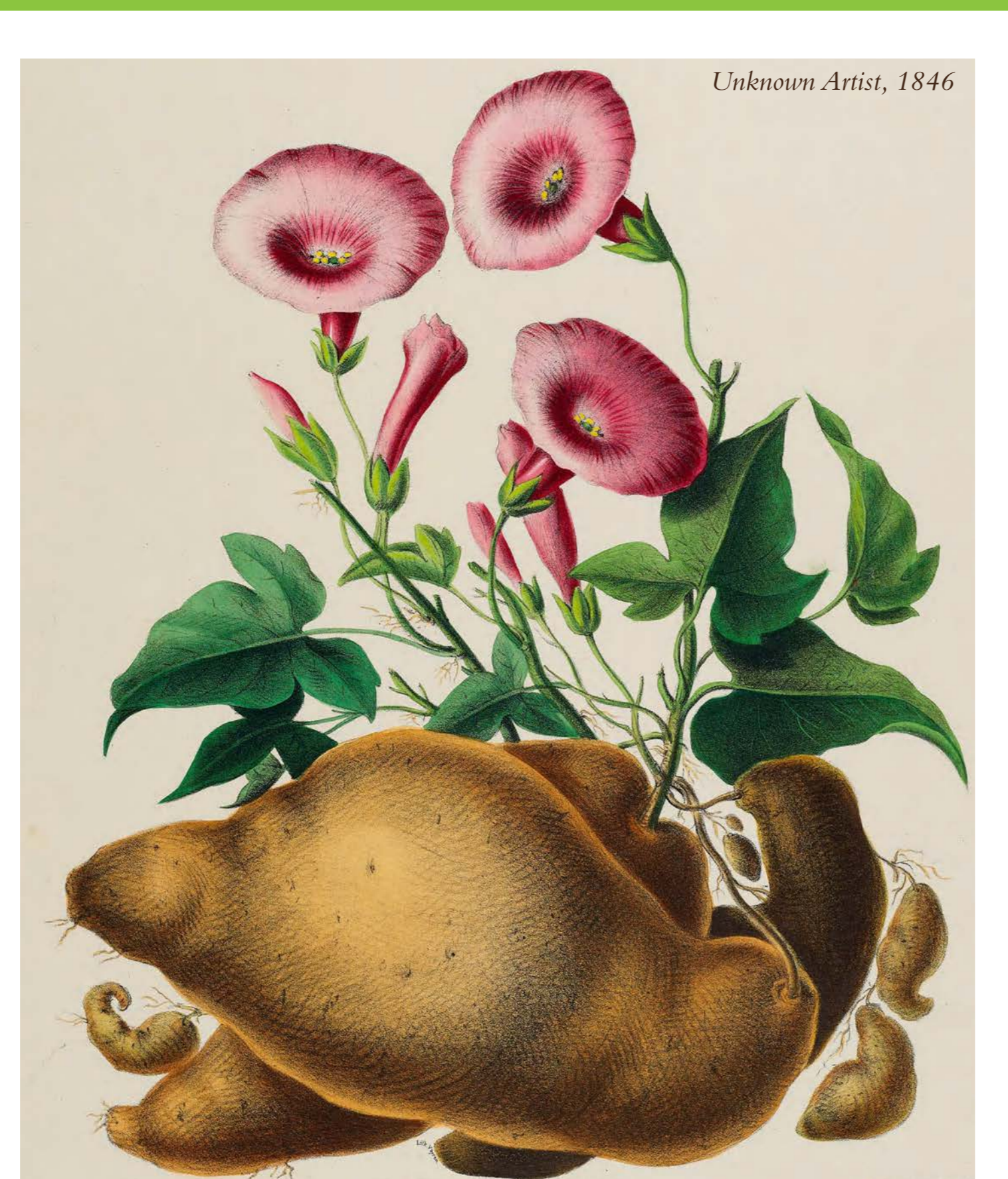
Sweet Potato • Patate Douce ( Ipomoea batatas )

Although many new crops arrived during the colonial period, these ancient root crops are still grown throughout the Caribbean. Beans , Pumpkin , Corn and other crops grown by Amerindians are also found in most gardens and farms. To this day, the crops and techniques of Amerindian farmers are still feeding Caribbean people.