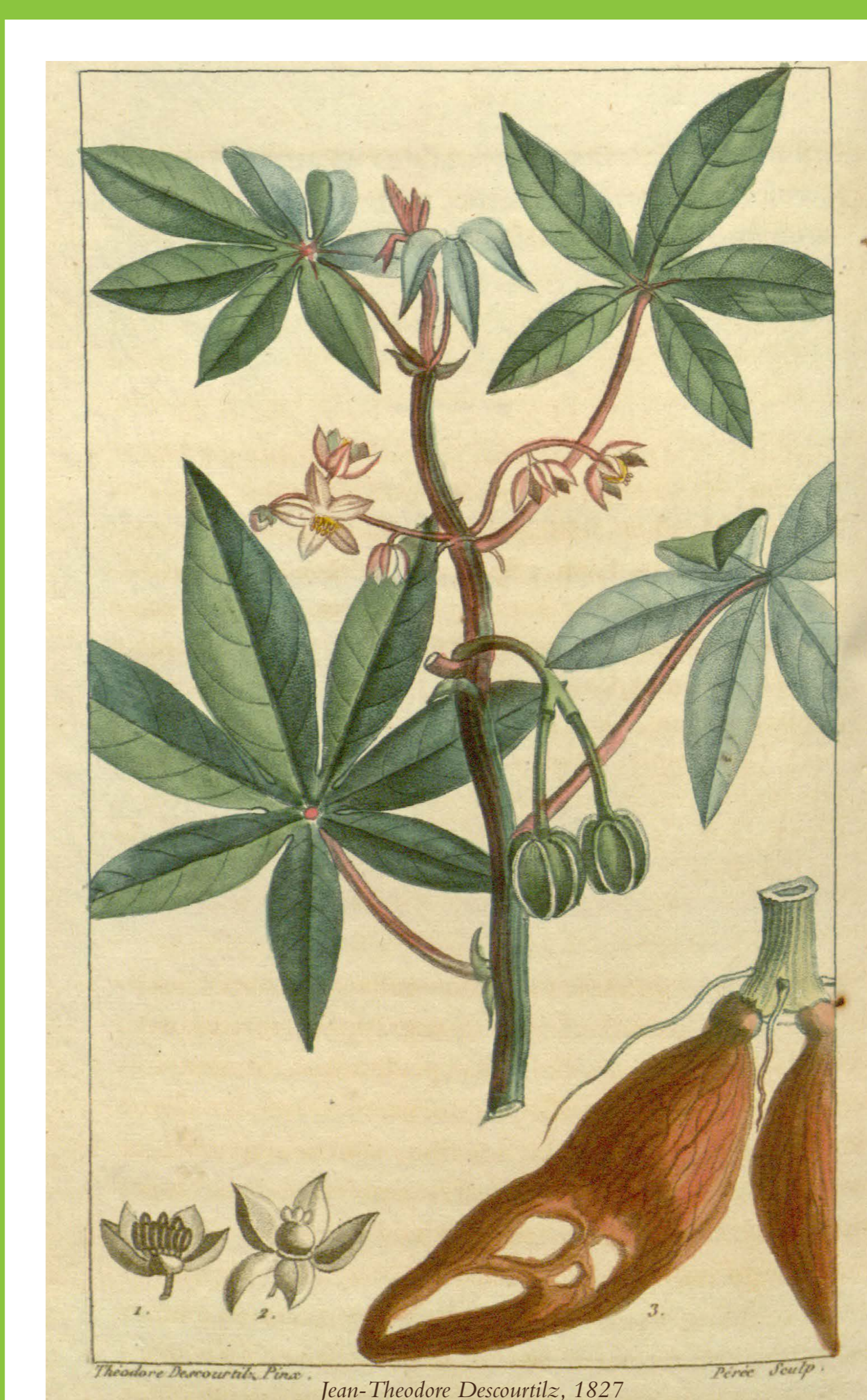
Cassava • Manioc ( Manihot esculenta )