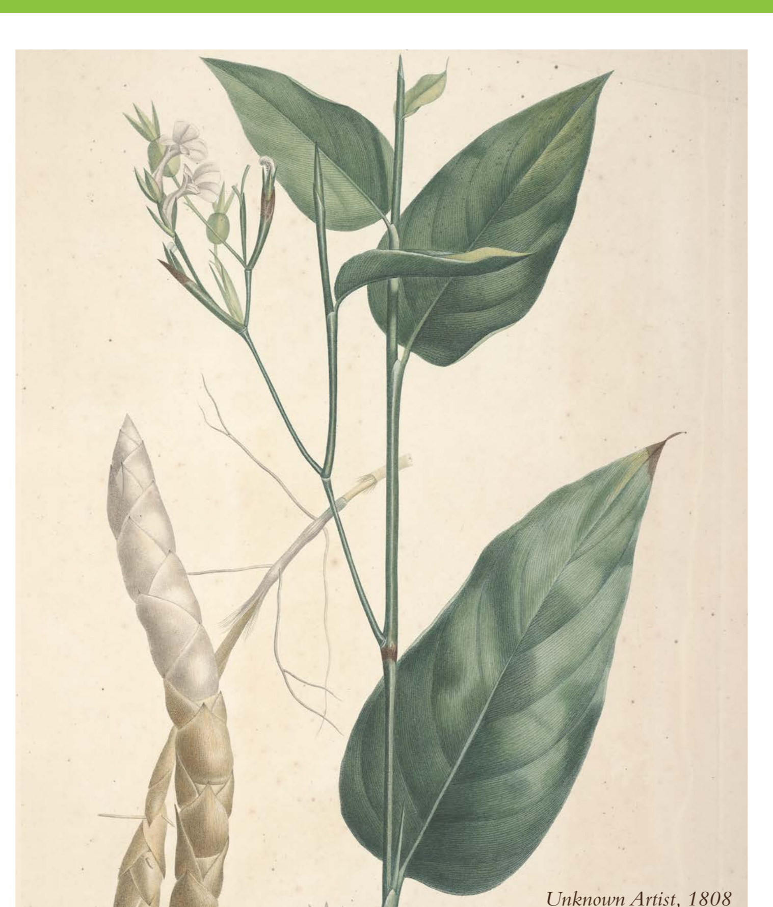
Arrowroot • Marante ( Maranta arundinacea )