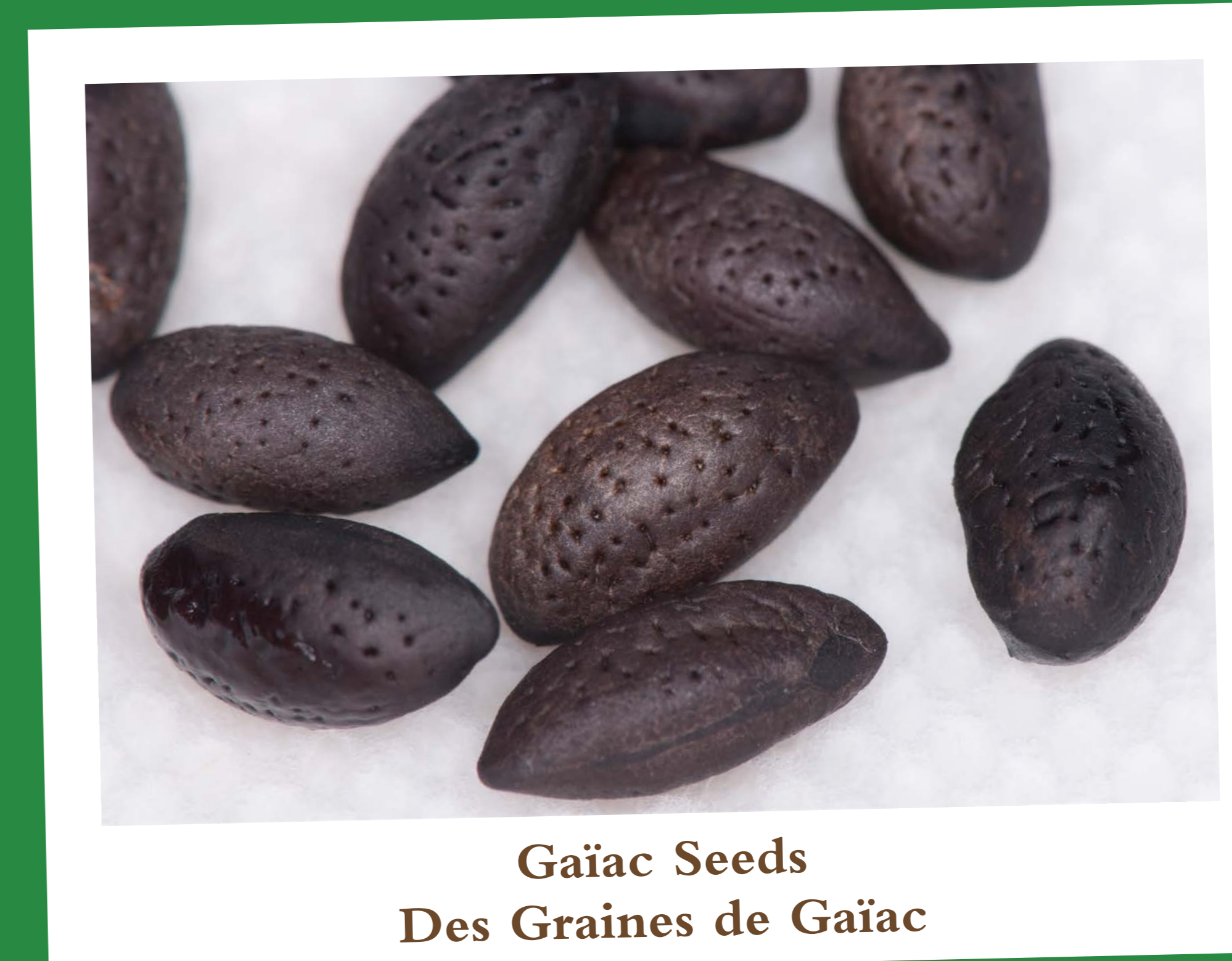
Gaïac Seeds Des Graines de Gaïac