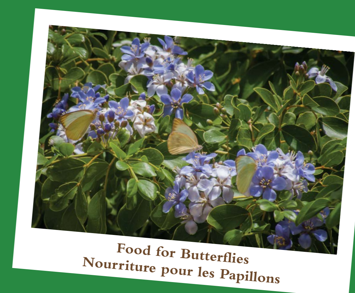
Food for Butterflies Nourriture pour les Papillons