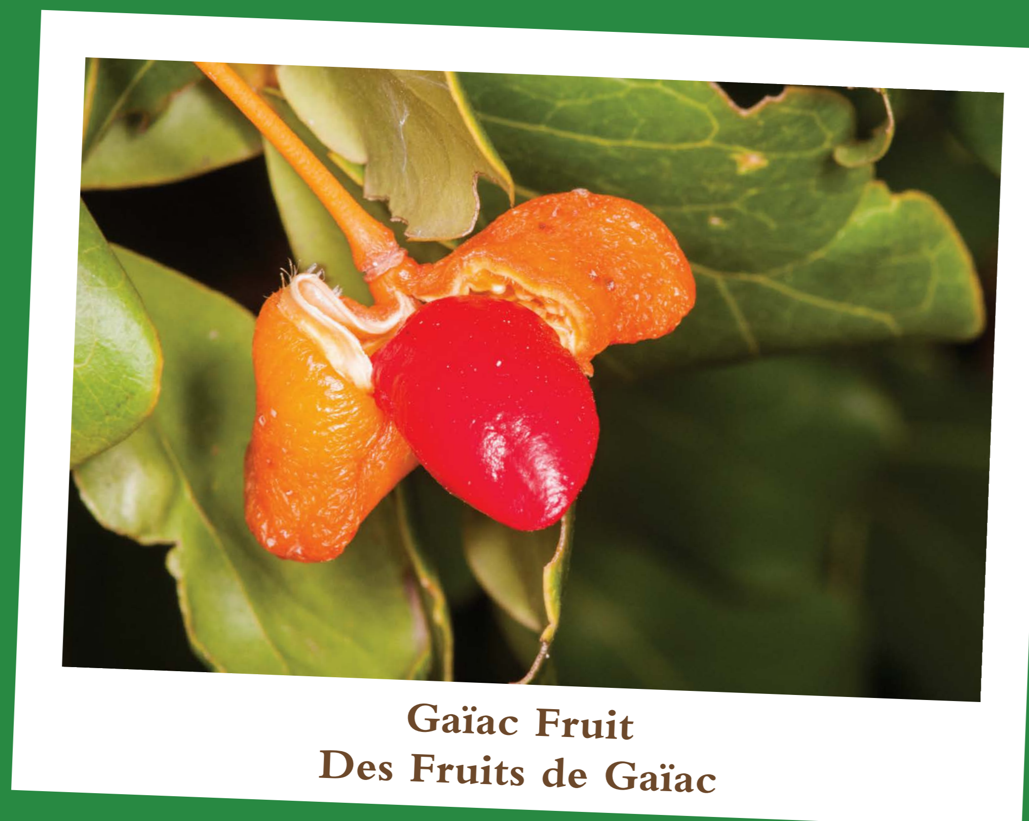
Gaïac Fruit Des Fruits de Gaïac