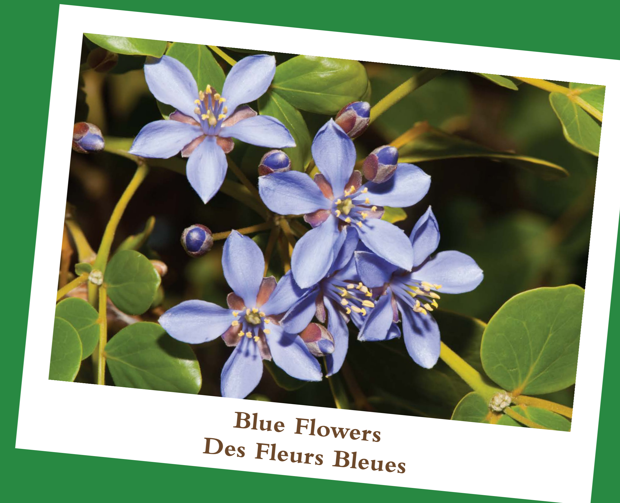
Blue Flowers Des Fleurs Bleues