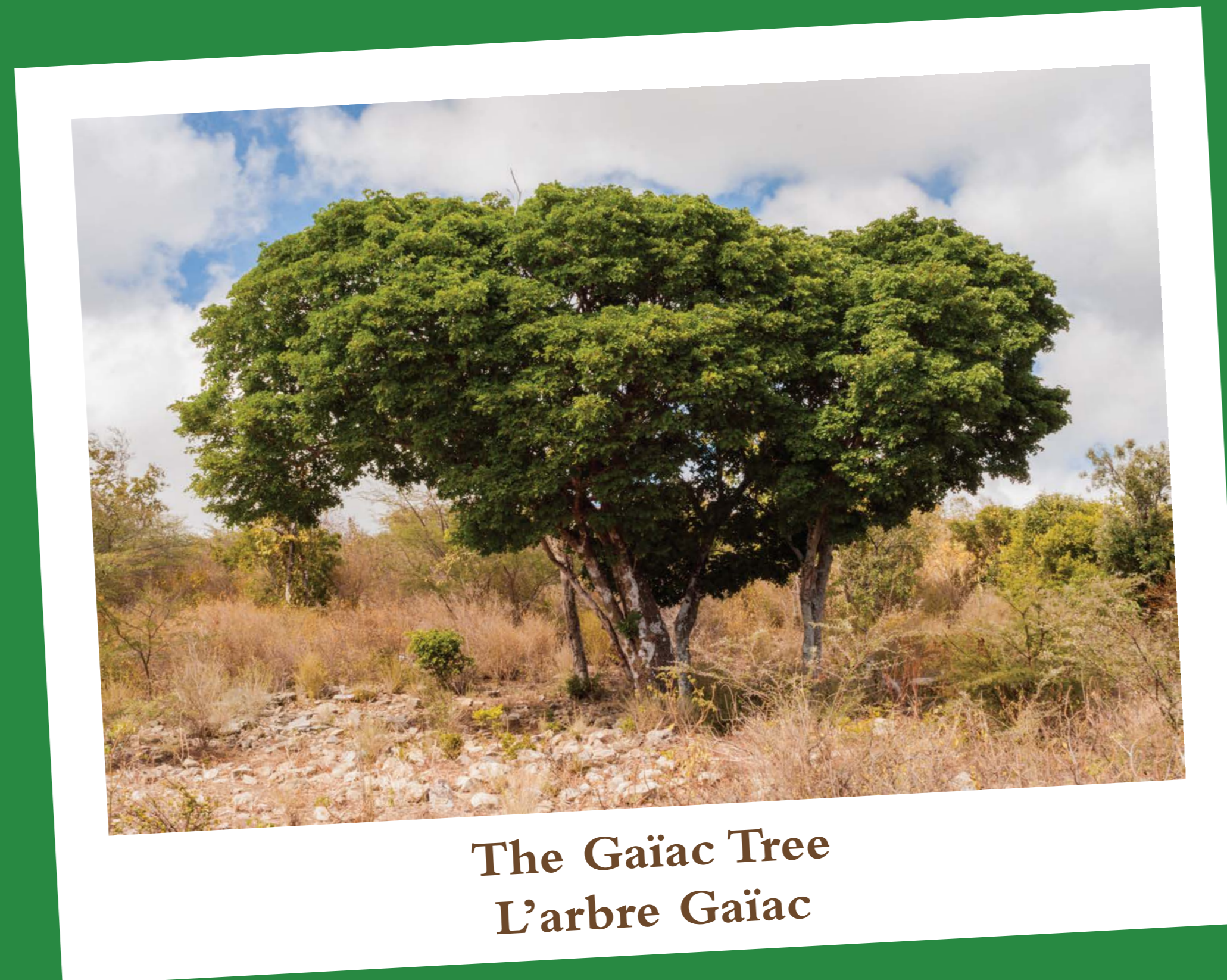
The Gaïac Tree L'arbre Gaïac

The Gaïac has beautiful blue flowers and colorful orange fruit and seeds encased in a bright red covering. Its branches are typically twisted and forked, creating a dense crown. Like other native trees, it provides shelter and food for a variety of local animals, from insects to birds. By planting this tree, we create habitat for native animals even in our own backyards, and help restore this heritage tree for future generations.