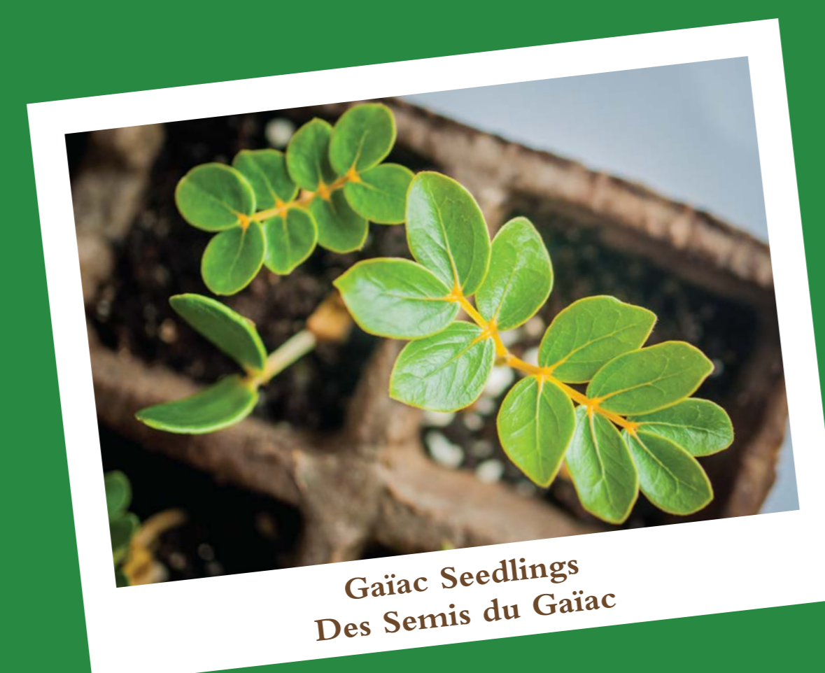
Gaïac Seedlings Des Semis du Gaïac