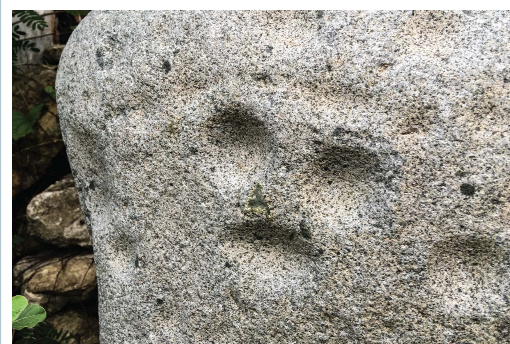
Many simple faces are carved into the Moho stone. These decorations tell us that the stone was more than just a place to make tools.