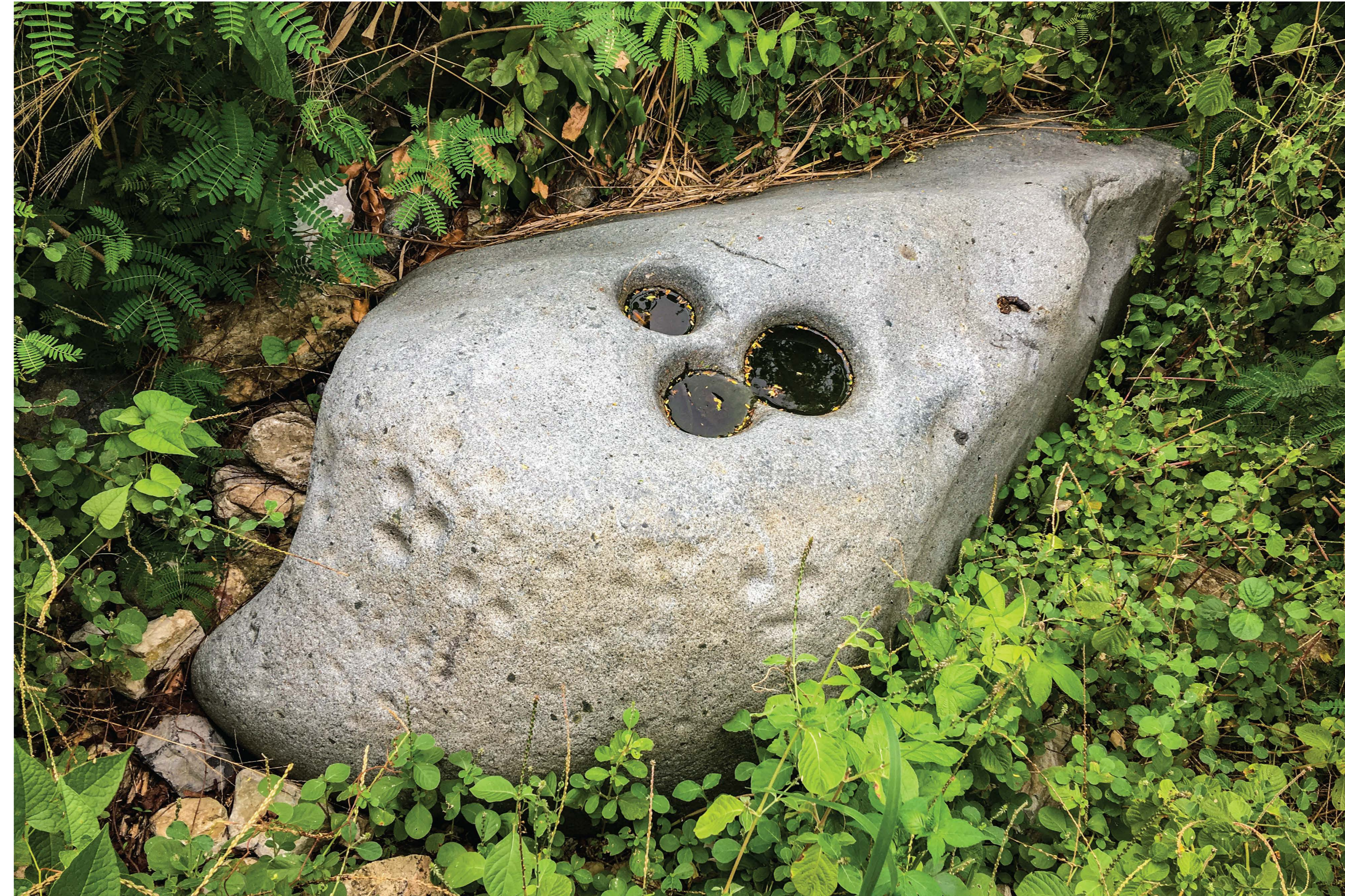
The Moho stone is a petroglyph, a stone carving made by early Amerindians. It shows us that people were living in the French Quarter area long before recorded history.

On the most densely populated island in the Caribbean, this stone is a reminder that all the roads and buildings are a very recent development. All of St. Martin's recorded history is just a short time, and people were here long before that. The Moho stone is a rock of ages, and you can stand beside it today to consider its epic past, and the people who were part of it.