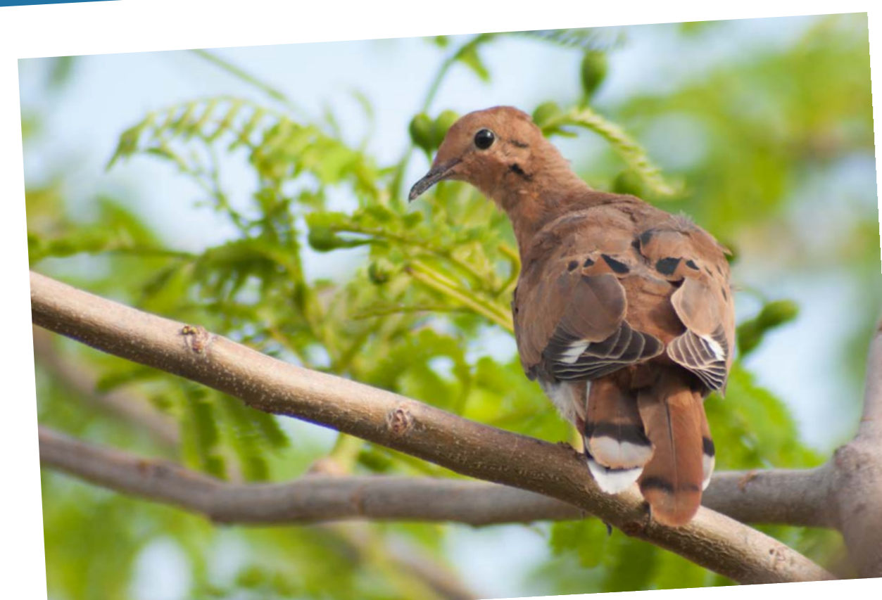
Zenaida Dove • Colombe Zénaïde Zenaida aurita aurita

Subspecies range: Lesser Antilles, Puerto Rico, Virgin Islands Aire de répartition de sous-espèce: Petites Antilles, Porto Rico, Îles Vierges