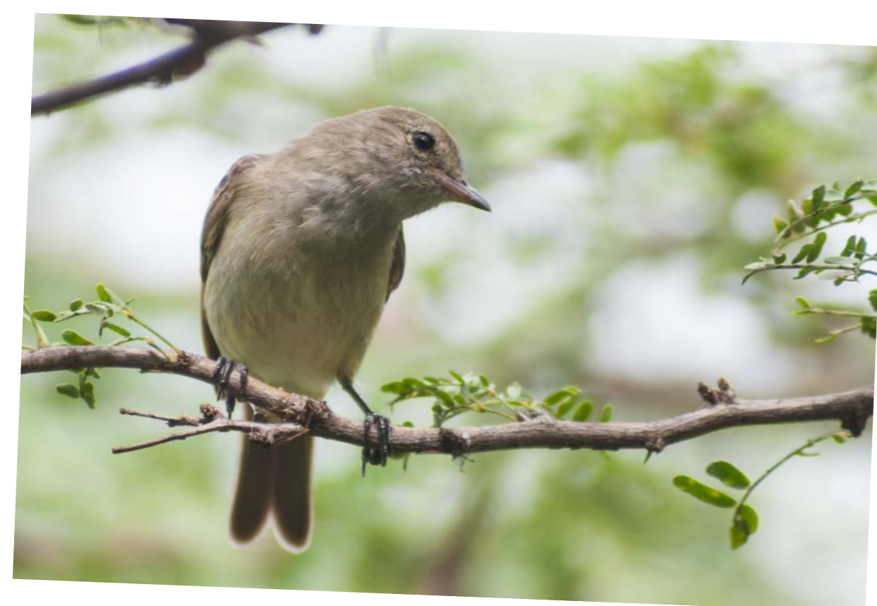
Caribbean Elaenia • Elénie Siffleuse Elaenia martinica riisi

Comme les oiseaux peuvent voler d'île en île, il n'existe pas d'oiseau ne vivant que sur St. Martin. Cependant, un nombre des oiseaux communs sur St. Martin ne se trouvent que dans notre région. Il existe aussi ici des oiseaux qui sont répandus ailleurs mais qui ont une variété ou des sous-espèces particulières dans notre région.