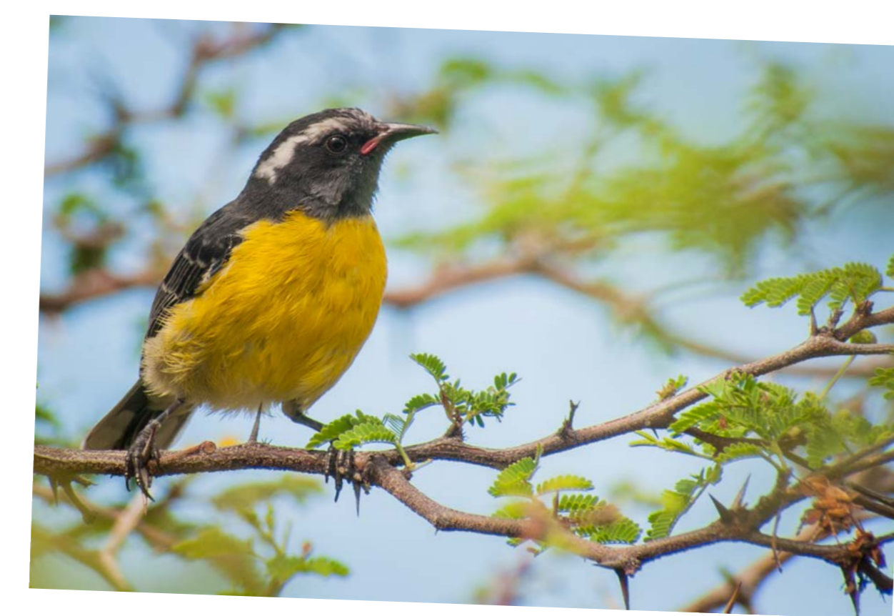
Sugar Bird/Bananaquit • Sucrier Coereba flaveola bartholemica

Aire de répartition d'espèce: Caraïbes Aire de répartition de sous-espèce: Nord des Petites Antilles Ce passereau, connu localement sous le nom Siffleur ou Fio-fio, émet un beau sifflement et est observé dans les aires buissonneuses.