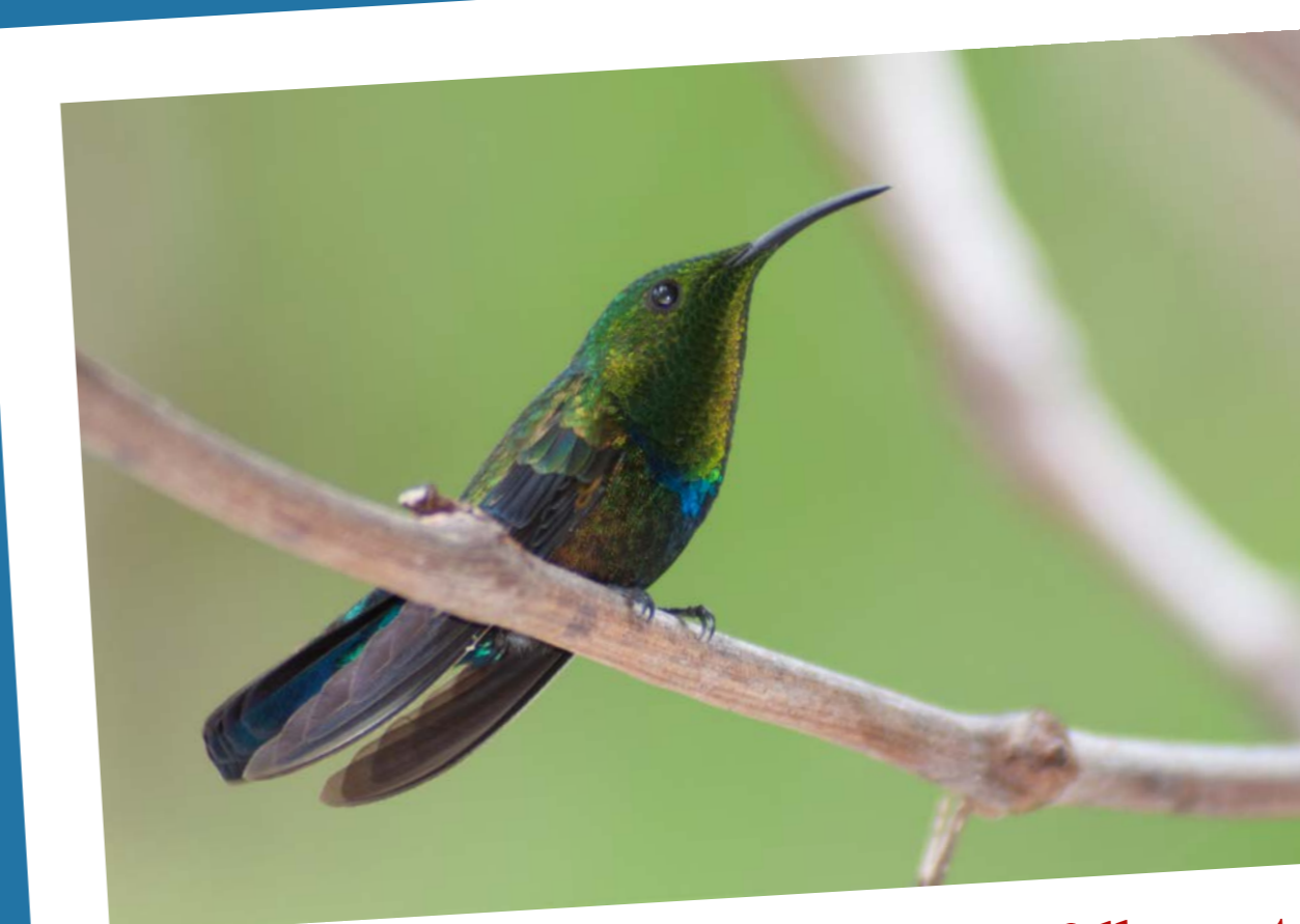
Green-throated Carib • Colibri falle-vert Eulampis holosericeus

Aire de répartition d'espèce: Caraïbes Connu sous le nom de Grosse grive, cet oiseau était décrit par Kruythoff comme « un bel oiseau et un beau chanteur ». Il mange des insectes, des lézards, des fruits et des déchets alimentaires.