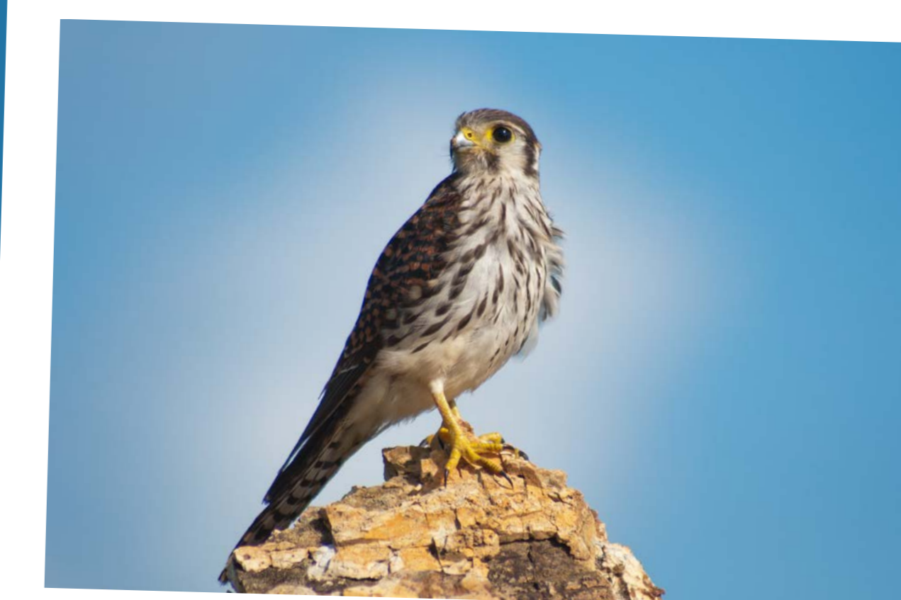
American Kestrel Crécerelle d'Amérique Falco sparverius caribaeorum

Aire de répartition d'espèce: Petites Antilles, Porto Rico, Îles Vierges C'est la plus grande des deux espèces de colibris, il est vert irisé sur son ventre et son dos et a un long bec incurvé. En fonction de la lumière cet oiseau peut apparaître totalement noir.