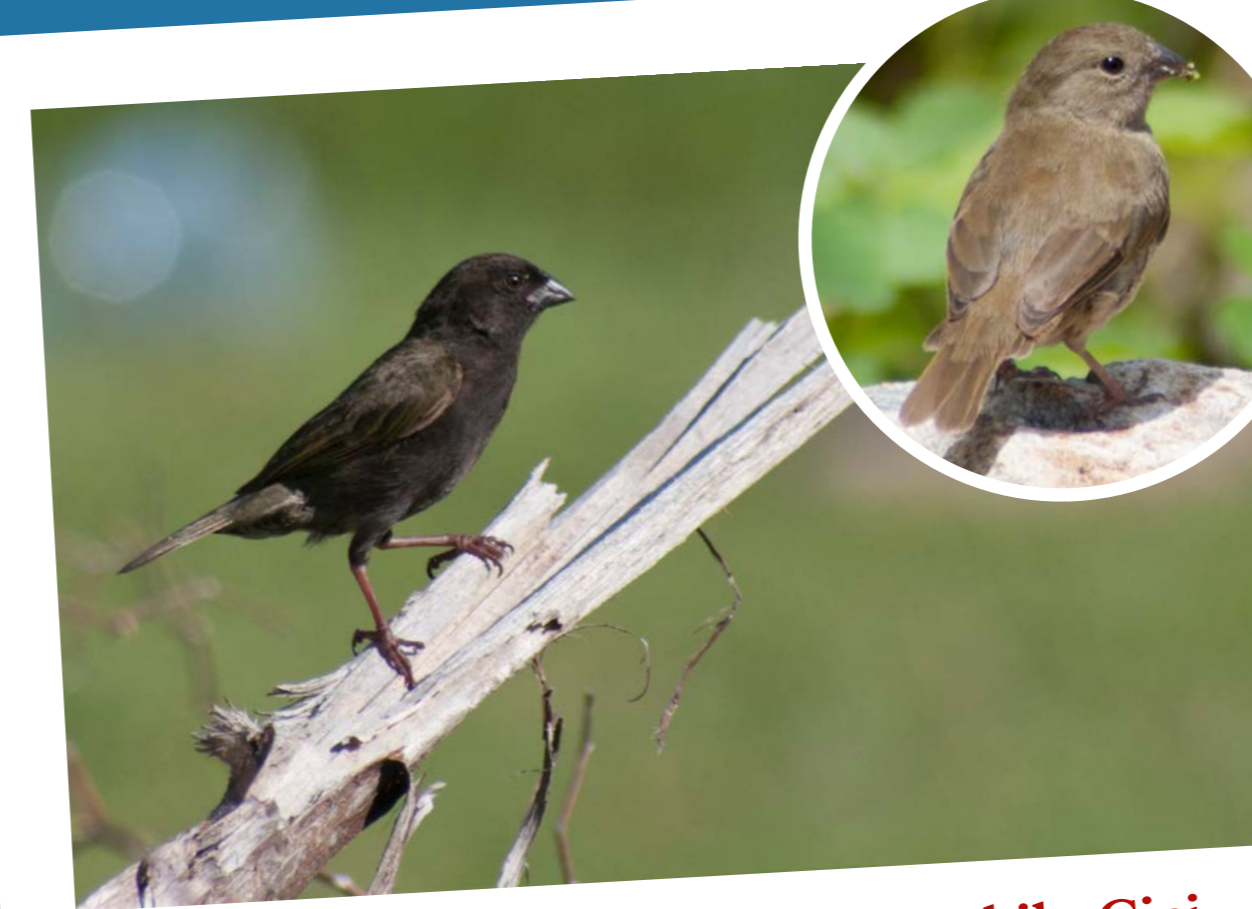
Black-faced Grassquit • Sporophile Cici Tiaris bicolor

Aire de répartition d'espèce: Caraïbes, Mexique, Amérique du Sud Aire de répartition de sous-espèce: Nord des Petites Antilles Cet oiseau, aussi appelé Sicrié, est l'un des plus fréquents de l'île. Sa classification reste encore incertaine, il est parfois considéré comme le seul représentant de la famille des Coerebidae.