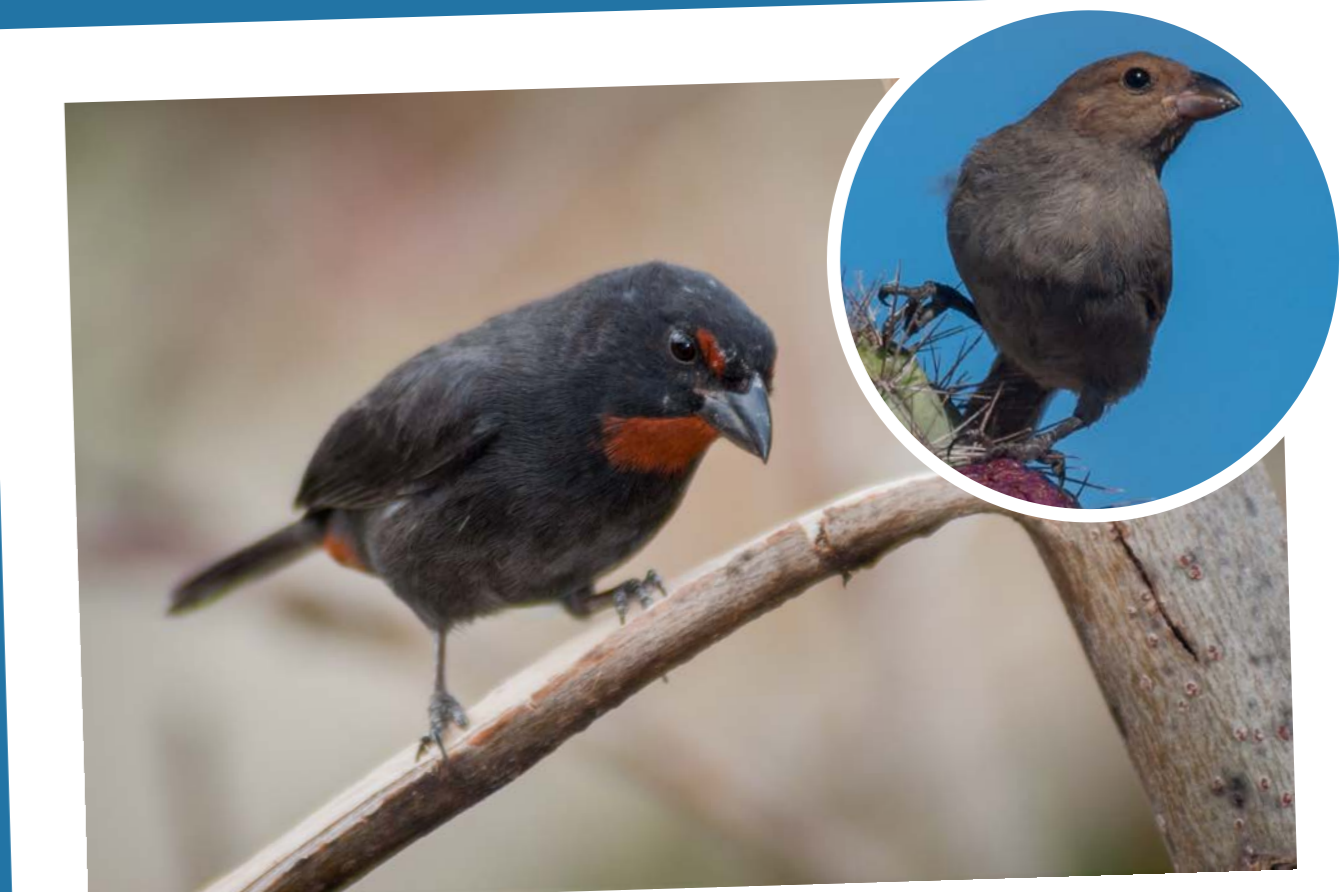
Lesser Antillean Bullfinch Sporophile Rouge-gorge Loxigilla noctis ridgwayi

Aire de répartition d'espèce: Petites Antilles et Amérique du Sud Aire de répartition de sous-espèce: Petites Antilles Bien qu'ils soient communs aujourd'hui, ils ont été vus pour la première fois à St. Martin au début des années 1970. Le mâle est noir, et la femelle et le juvénile de cette espèce sont gris-brun.