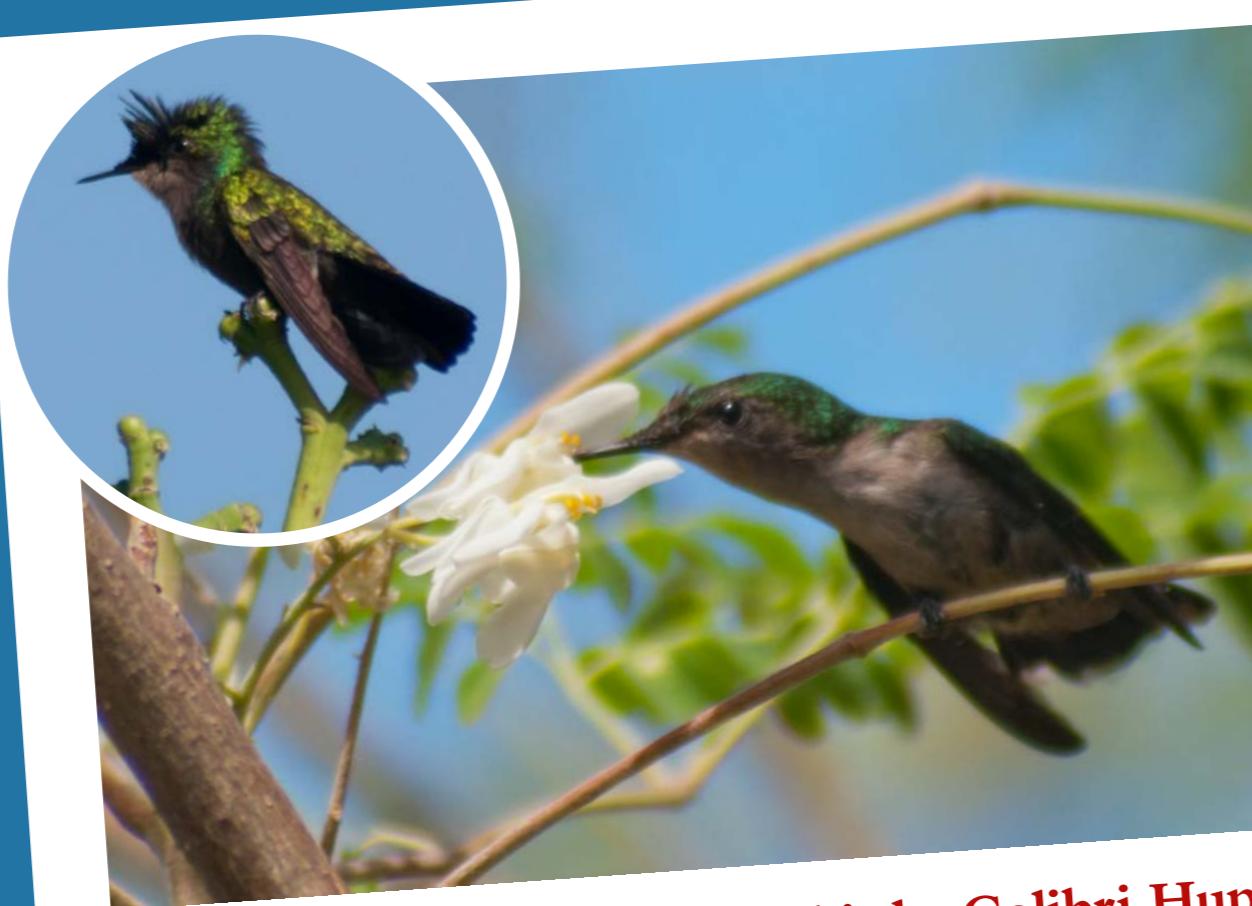
Antillean Crested Hummingbird • Colibri Huppé Orthorhynchus cristatus

Aire de répartition d'espèce: Petites Antilles et Îles Vierges Aire de répartition de sous-espèce: Nord des Petites Antilles Ce sporophile est endémique des Petites Antilles et des Îles Vierges. Il est aussi connu sous le nom de Rouge-gorge ou Gros bec. C'est un oiseau résident nicheur sur l'île.